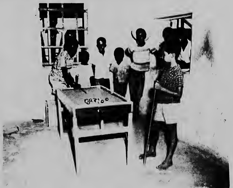
Tambe den Essolito Club tin facilidanan pa e hobentud pasa un tempo agradable y sano. Un wega di biljart semper ta cal na smaak di e muchanan, mientras otronan ta sigui e wega cu interes.